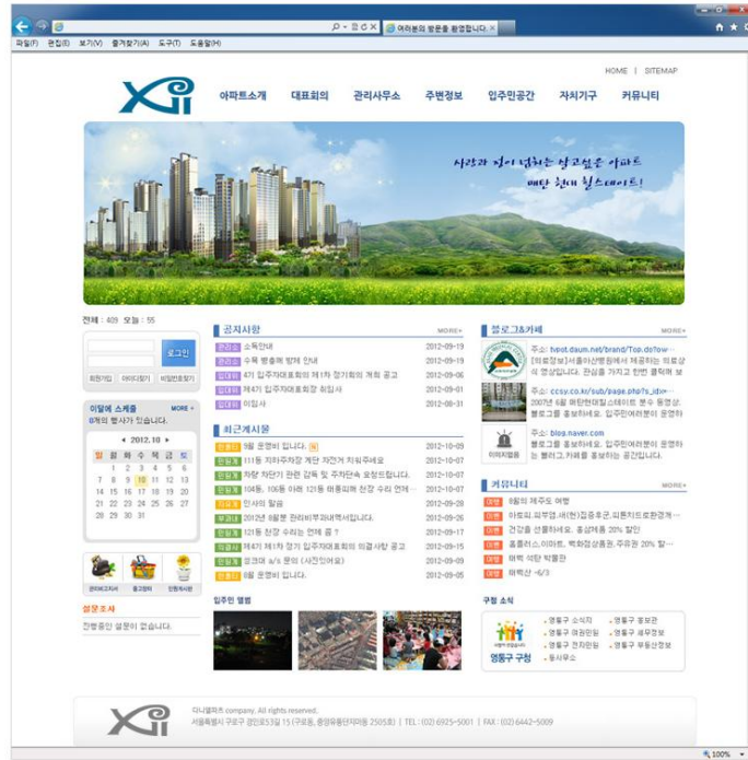
○ A Design